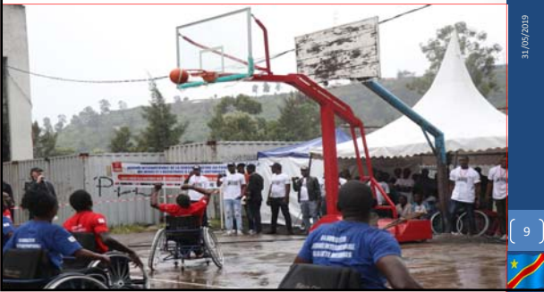
Match de Basketball des victimes de mines à Goma